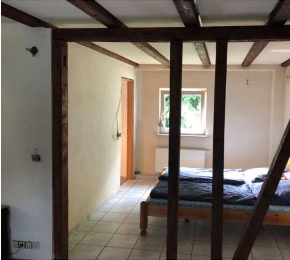
1OG Schlafen und Bad