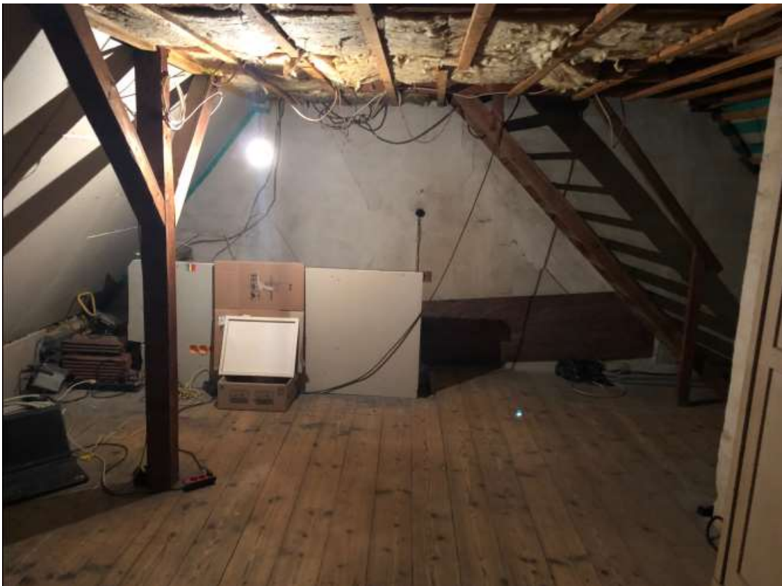
2 OG Haupthaus : nicht ausgebaut