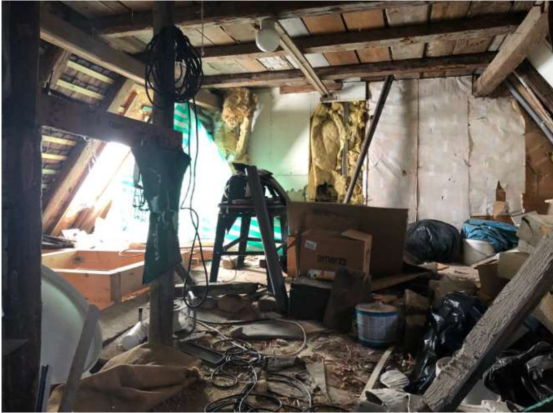
Scheune nicht ausgebaut

Der Keller beinhaltet einen alten Weinkeller und andere Kellerräume. Der Kellerboden bzw das Fundament besteht aus Erdboden welcher teilweise mit Beton aufgeschüttet wurde.