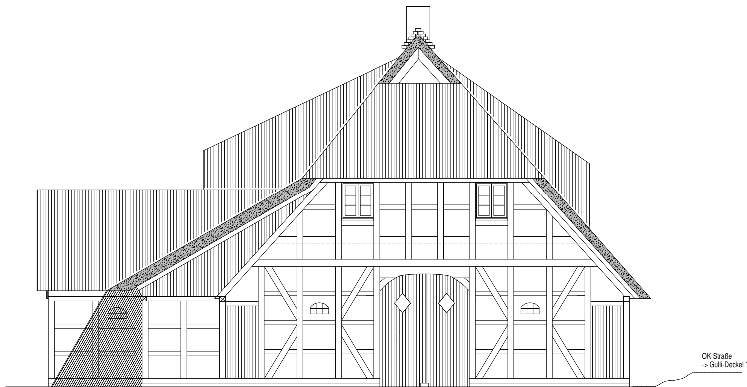
Ansicht West Entwurf/Ausführung